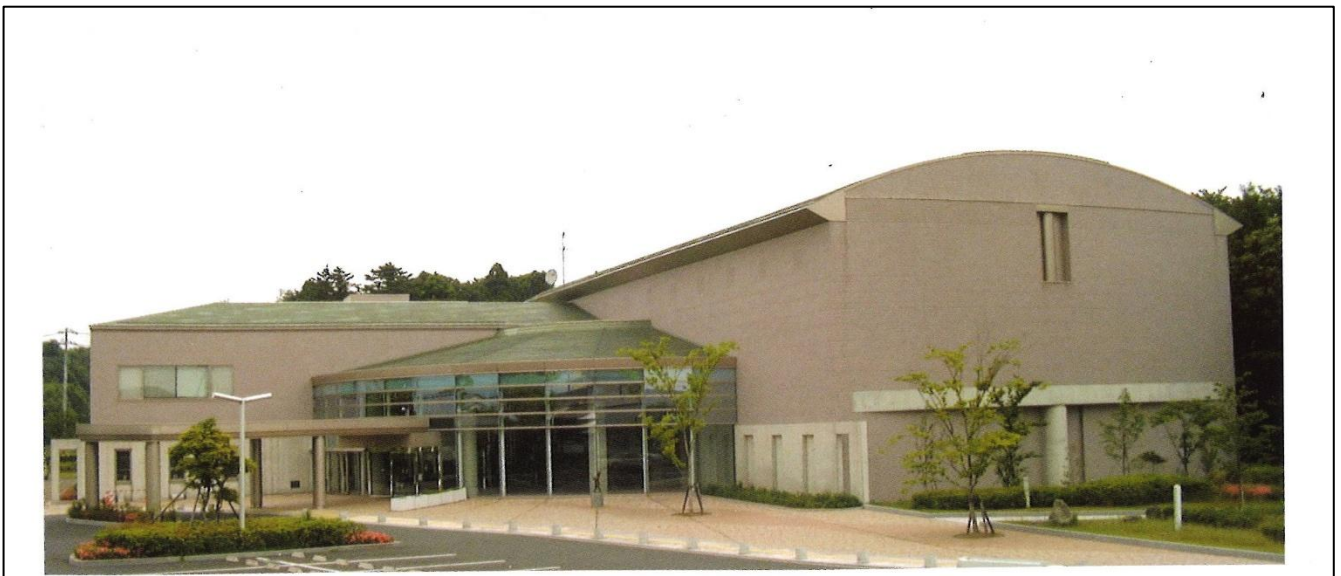
相馬市総合福祉センターはまなす館 外観