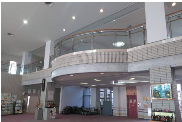
エレベーター（または階段）で2階へ